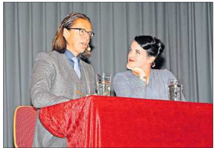
Bald mit „Elwenfels 3“ live zu erleben: die Habekosts.

Zur Story: Der den Lesern der „Elwenfels“-Saga hinlänglich bekannte Privatdetektiv Carlos Herb hat sich in Hamburg mit der Mafia angelegt und sucht Zuflucht in Elwenfels. Gleichzeitig ist eine Gruppe spiritueller Aussteiger angereist, um hier die Erleuchtung zu suchen. Zuerst sieht es so aus, als könnten